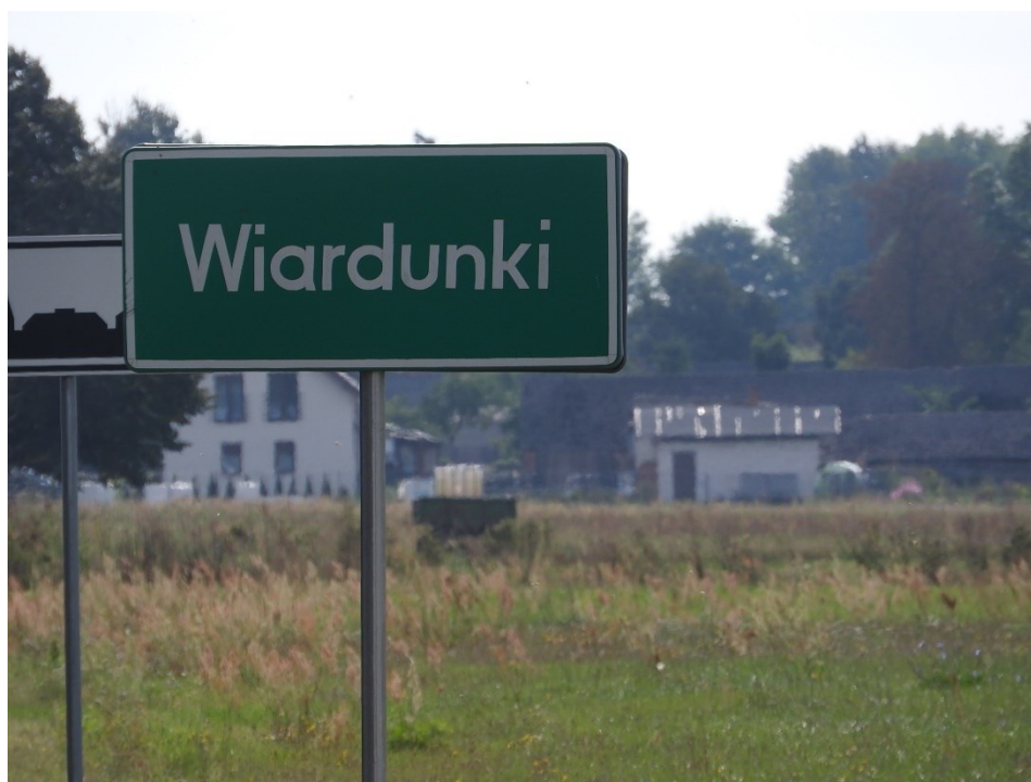
Zdjęcie 1 Wjazd do miejscowości Wiardunki