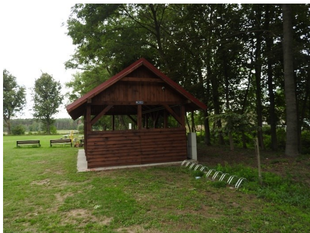
Zdjęcie 8 Wielofunkcyjne miejsce rekreacji