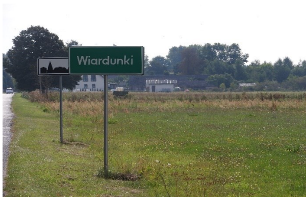
Zdjęcie 7 Droga dojazdowa do miejscowości Wiardunki