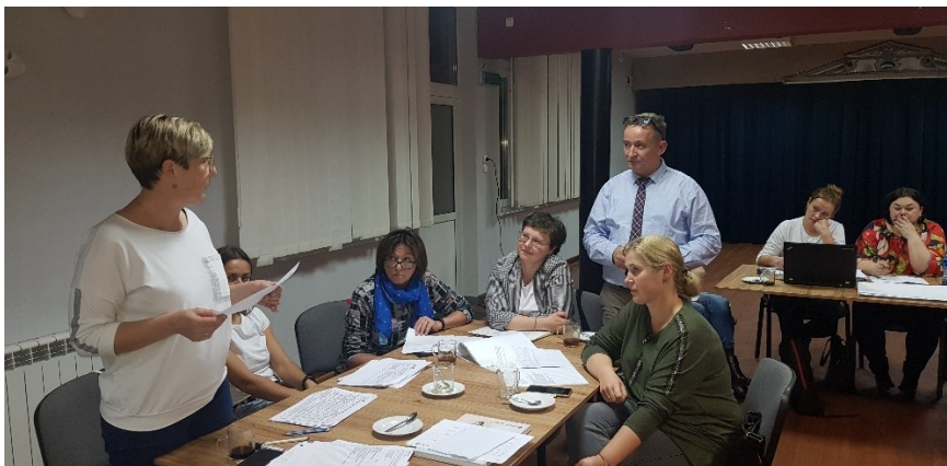
Zdjęcie 3 Warsztaty pisania SSR – listopad 2021