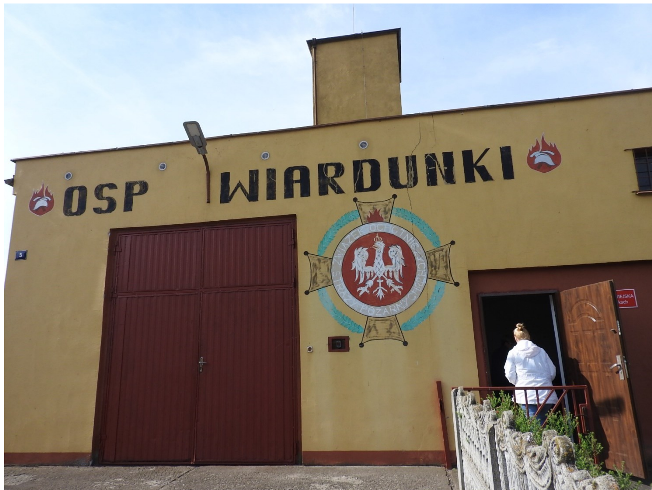
Zdjęcie 5 – OSP Wiardunki i Świetlica Wiejska w budynku po byłej kuźni.

oczekiwań mieszkańców, ponieważ jedną tego typu instalacją jest sieć wodociągowa, brak natomiast sieci kanalizacyjnej, gazowej oraz światłowodów. Infrastruktura drogowa na terenie sołectwa to drogi o nawierzchni bitumicznej i gruntowej.