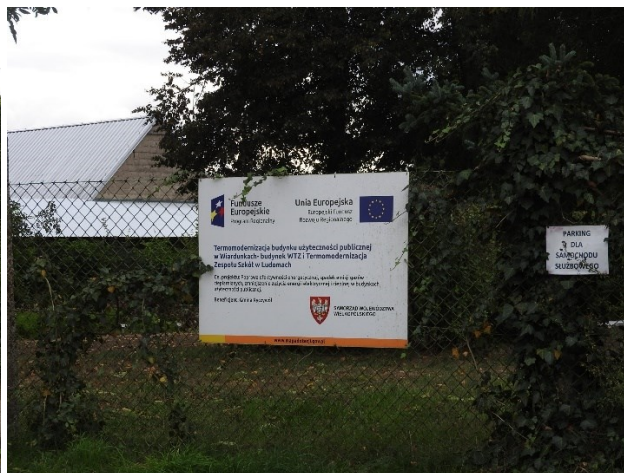
Zdjęcie 14 Zadanie z wykorzystaniem środków Europejskich