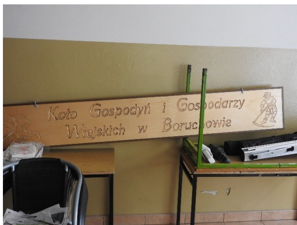
Zdjęcie 12 KG i G W w Boruchowie