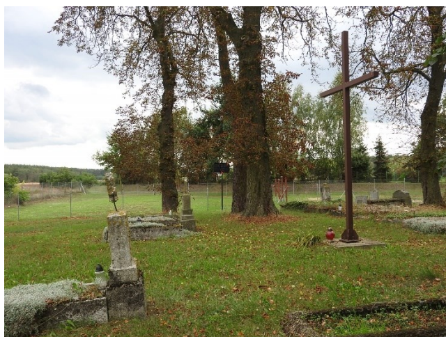
Zdjęcie 11 Cmentarz ewangelicki