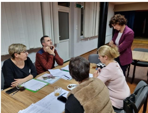
Zdjęcie 16 Wizja obrazkowa miejscowości wykonana podczas warsztatów przez Przedstawicieli GOW