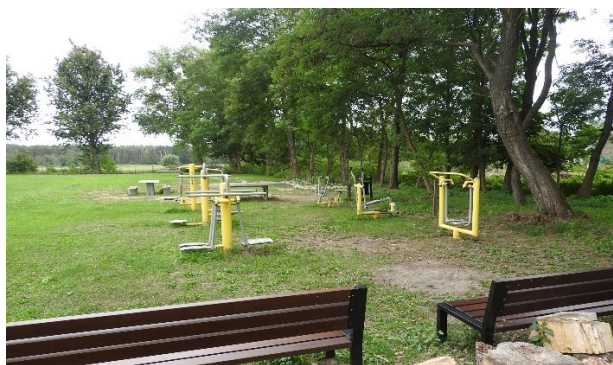
Zdjęcie 9 Obiekt rekreacyjny