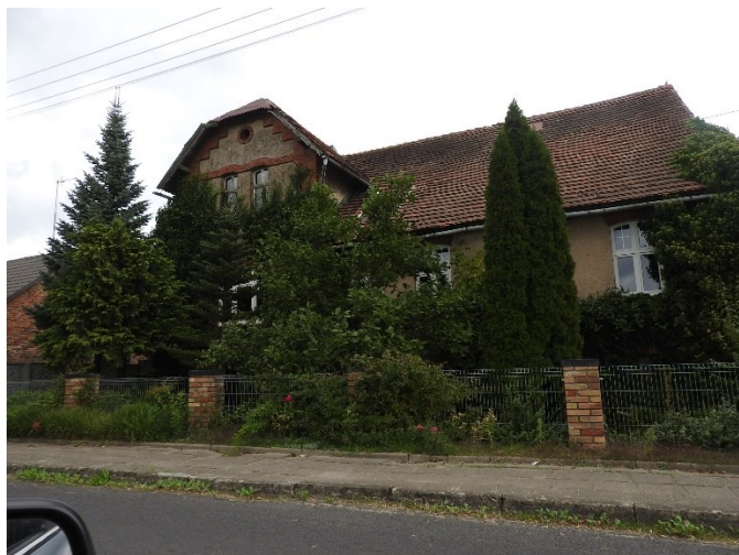
Zdjęcie 13 Jeden ze starych budynków sołectwa