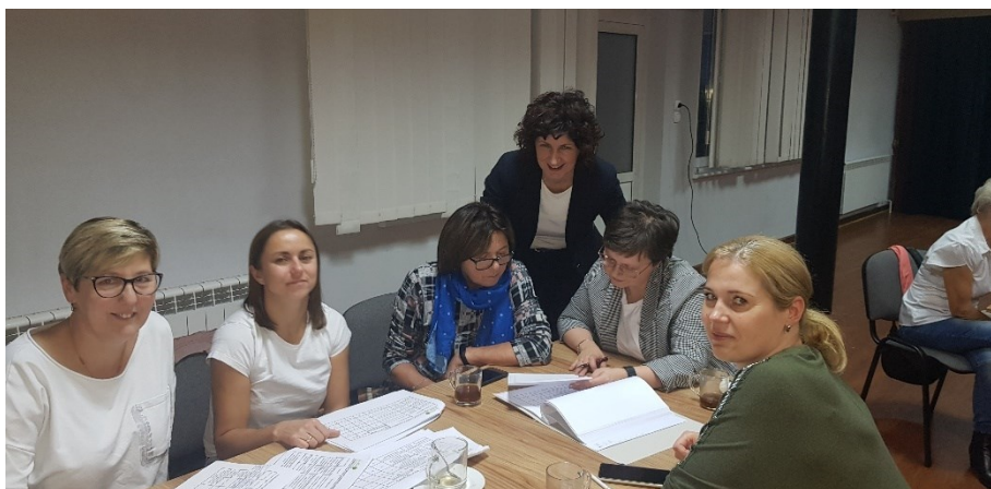
Zdjęcie 2 Warsztaty pisania SSR – listopad 2021

Drugie warsztaty odbyły się w dniu 20.11.2021 roku. Warsztaty w tym dniu polegały na wskazaniu na podstawie przeprowadzonych wcześniejszych analiz, projektów i działań związanych z opracowaną wizją rozwoju sołectwa na podstawie opracowanej Analizy Potencjału Rozwojowego. Tak powstał plan długo i krótkoterminowy. W planie krótkoterminowym wskazano te projekty/zadania, które mieszkańcy sołectwa planują zrealizować w pierwszej kolejności – w okresie 12 miesięcy. Następnie w ramach planu długoterminowego zaplanowano zadania na lata przyszłe. W planie długoterminowym wskazano cele jakie sołectwo stawia sobie na podstawie wcześniejszych analiz i chce je osiągnąć w najbliższych pięciu latach w poszczególnych obszarach potencjału rozwojowego.