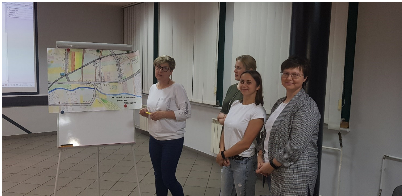
Zdjęcie 15 Praca grupowa – prezentacja wizji rozwoju sołectwa j