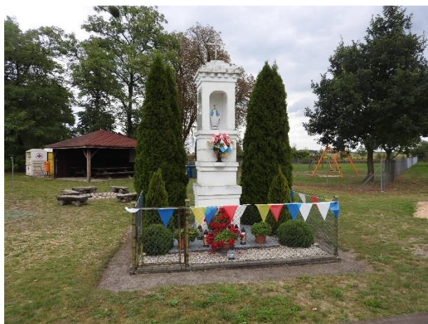
Zdjęcie 10 Kaplica przydrożna w Boruchowie