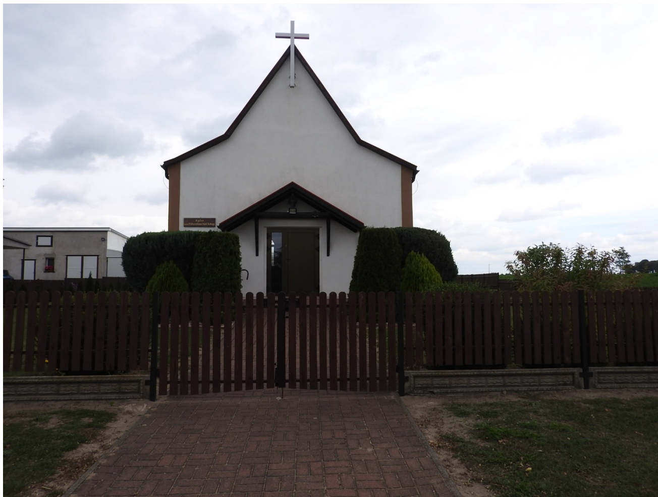
Zdjęcie 6 – Kaplica kościelna we wsi Wiardunki p.w. św. Maksymiliana M. Kolbego