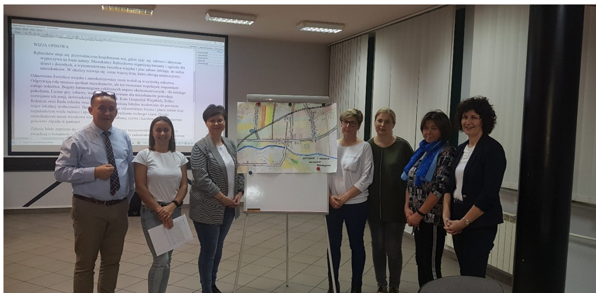
Zdjęcie 4Wizja zobrazowana na makiecie rozwoju sołectwa – listopad 2021

Przedstawiciele Grupy odnowy wsi wykonali również graficzną wizję miejscowości – którą następnie zaprezentowali pozostałym uczestnikom warsztatów.